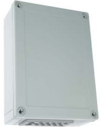
Mitat: 180x130x60 (LxBxH)

Lisäksi voidaan kytkeä 4 kohdepoiston mittauselintä ja 3 rajakytkintietoa kohdepoistoista.